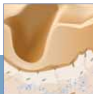
PRIJE: duboke bore

To je visokokvalitetna hijaluronska kiselina. Dermatolozi je koriste u injekcijama za popunjavanje bora.